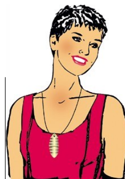
Le Vitalon Cleaning se porte sur le Chakra cardiaque ou sur le plexus solaire