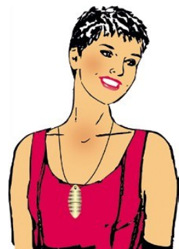
Le Vitalon Cleaning se porte sur le Chakra cardiaque ou sur le plexus solaire