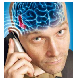
Rayonnement nocif du téléphone