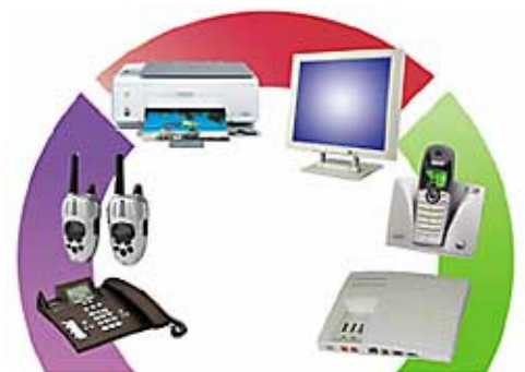
La Puce Ray-Harmony 2015 peut harmoniser de nombreux appareils