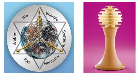
Ancienne Ray-Harmony et Sphère MerKaBa